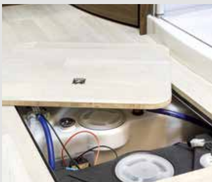
FRANKIA dobbeltgulv: Trinnløst og gjennomgående oppvarmet