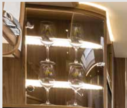
Eksklusivt skap med glassdører for dine FRANKIA vinglass