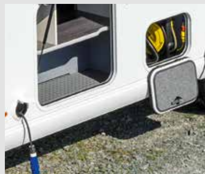
Selvopprullende kabeltrommel med 15 m kabel og sentralforsyning