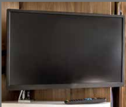
Flatskjerm 24 tommer