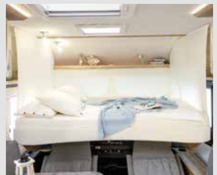
Elektrisk justerbar heveseng i Integrete