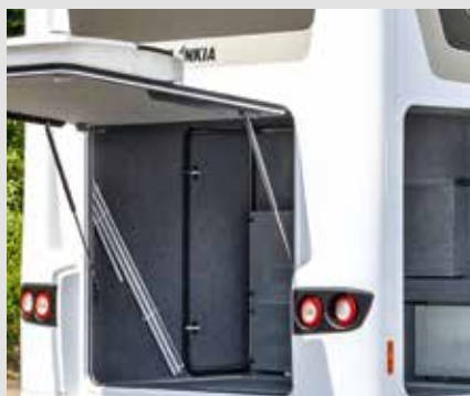
Laste inn og ut av garasjen med justerbare hekk- og sideklaffer