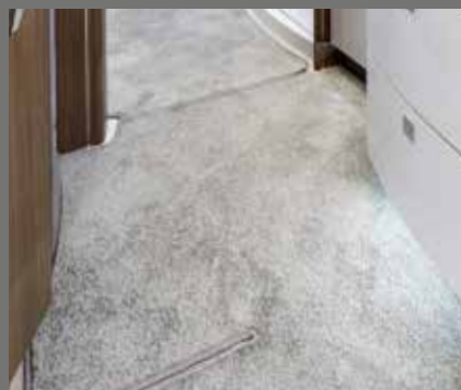
Letstelt teppegulv i hele det innvendige rommet