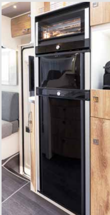
Kjøleskap og fryseskap i TecTower kan nå åpnes på begge sider

Standardutstyr på FRANKIA M-Line (utvalg)