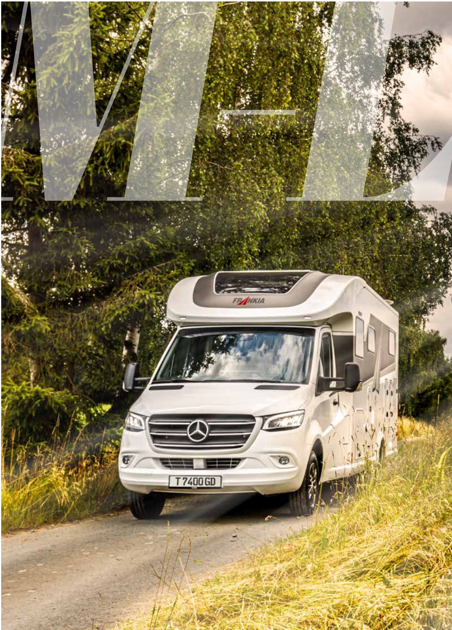
2 FRANKIA T 7400 GD (bilde som eksempel)