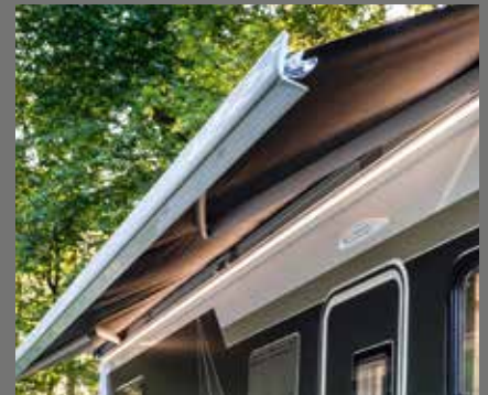
Markise – som ekstrautstyr med integrert LED belysningsprofil