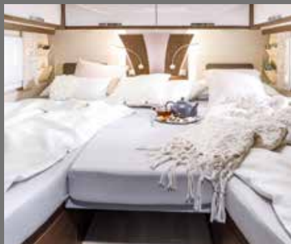
Mye plass: Sengeutvidelse for separate senger (GD)