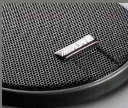
Alpine Dolby Surround høyttalersystem