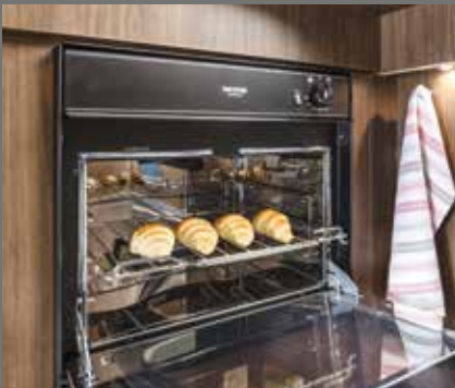
Integrert stekeovn fra Thetford