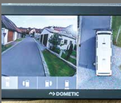
Full oversikt: Bird-View-Cam med 360° sikt og stort display