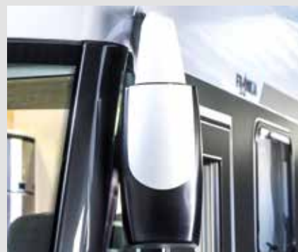
Ytterspeil med elektrisk justering og oppvarming