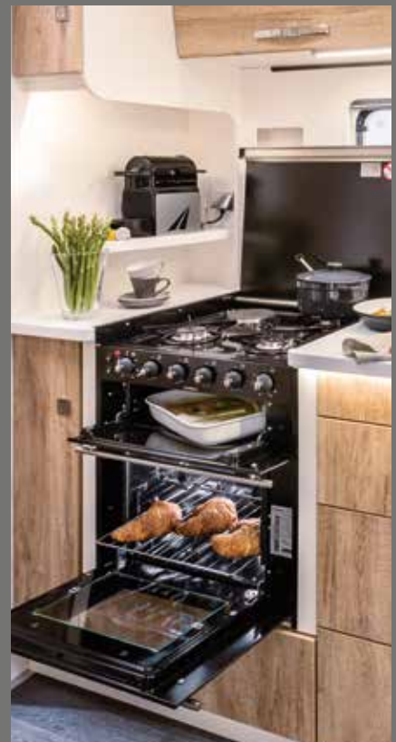
Kjøkkensøyle/komfyrkombinasjon (med grill, gass stekeovn, 3-bluss koketopp)