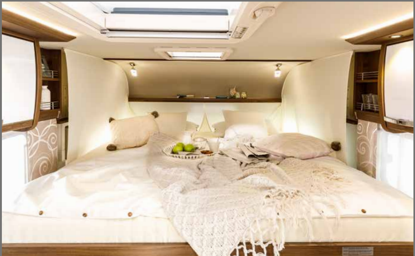
Ideell for å sove på tvers og på langs: Uttrekkbar FRANKIA duoseng (2 x 2 m)

Spesialutstyr på FRANKIA M-Line (utvalg)