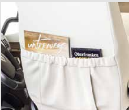
Praktisk: Lommer på førersetene (ved alle Integrete fra FRANKIA)